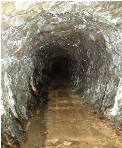
Miniera "Quattro Ossi" di Pontasio (Bs)

Per un eventuale pernottamento è prevista una convenzione con un l'albergo (in fase di definizione).